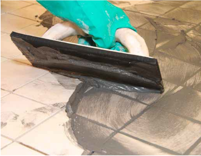
7 Het voegen van tegels met een zeer lage wateropname met Sopro DF 10®.