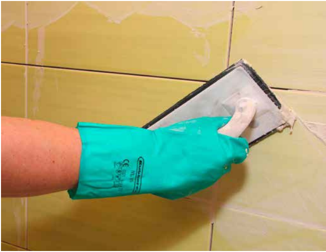
9 Het voegen van hard gebakken tegels met Sopro DF 10®.