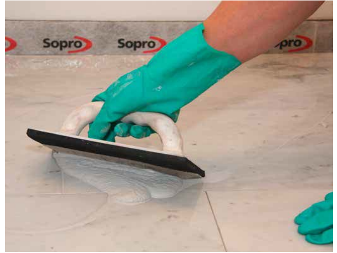
8 Het voegen van natuursteen gevoelig voor verkleuring met Sopro DF 10®.