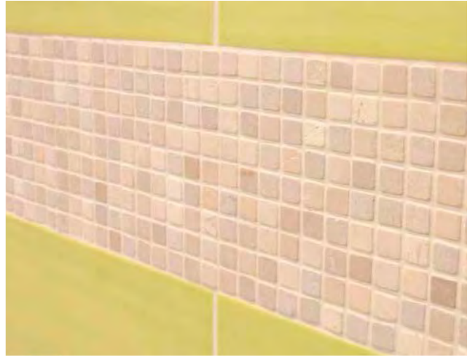
10 Oppervlakken van hard gebakken tegels en natuursteenmozaïek gevoegd met Sopro DF 10®.