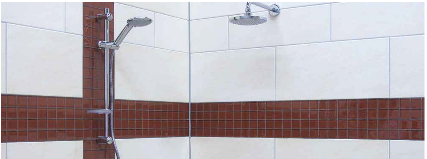
11 Gevoegde oppervlakken met een mooie kleurglans in een badkamer.